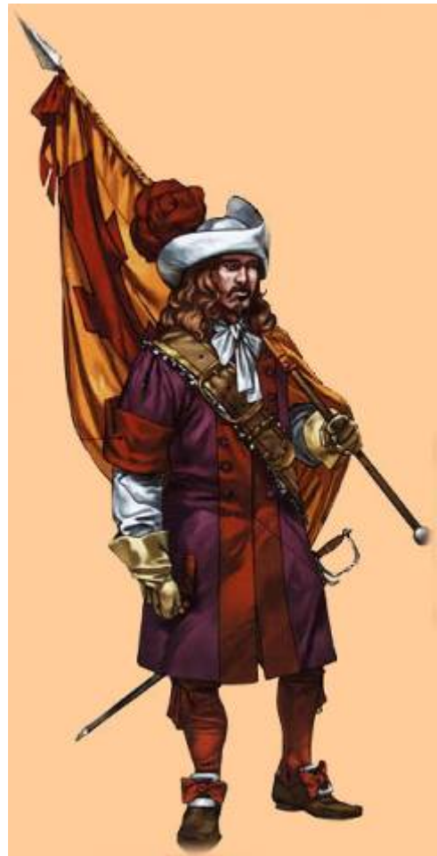
Abanderado del Tercio de Sevilla "Los Morados Viejos" (1700).

En la batalla de Almansa, que tuvo lugar el 25 de Abril de 1707, se enfrentaron los partidarios de Felipe de Anjou (Felipe V) contra los seguidores del archiduque Carlos de Austria en el contexto de la Guerra de Sucesión española. La contienda se decantó del lado franco-español y fue una victoria decisiva para el bando borbónico, pues despejó el camino para la toma del reino de Valencia y, posteriormente, de Aragón.