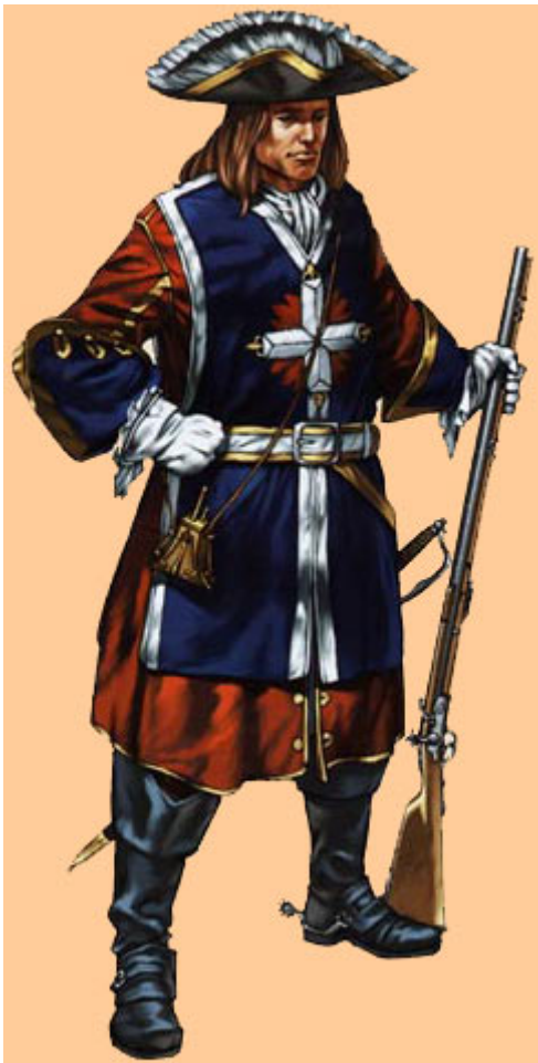
Mosquetero español de la Guardia de Felipe V (1702).